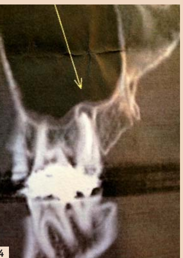
Abb. 1: Ohrreflexzonen. – Abb. 2: Nadeln in Ohrreflexzonen. – Abb. 3: Röntgenbefund 27. – Abb. 4: CT-Befund bei 27.