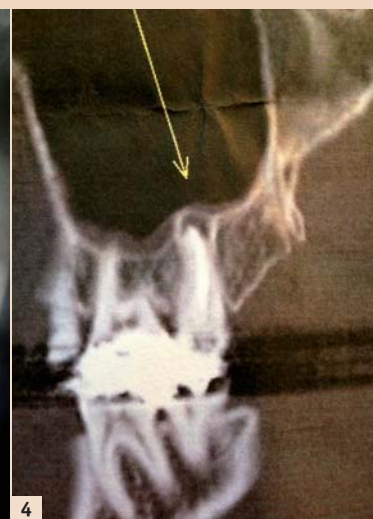
Abb. 1: Ohrreflexzonen. – Abb. 2: Nadeln in Ohrreflexzonen. – Abb. 3: Röntgenbefund 27. – Abb. 4: CT-Befund bei 27.