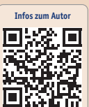
Infos zum Autor

„Unsere Geräte sind führend auf dem Weltmarkt ...“