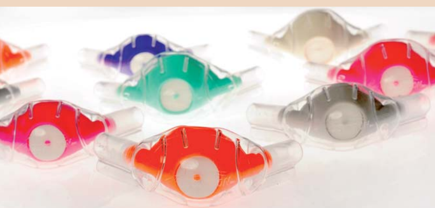
sedaview® – Doppelmaske in verschiedenen Grössen und Düften.