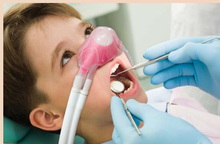
sedaview® – die einzigartige Doppelmaske von BIEWER medical.