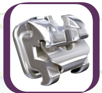
In-Ovation® R : Das Original! Das führende selbstligierende Metallbracket

In-Ovation® – DENTSPLY GAC bietet eine komplette Produktserie bei selbstligierenden Brackets. In-Ovation® Brackets – unübertroffen in Design, Vielseitigkeit, Zuverlässigkeit und Effizienz für präzise Resultate und zufriedene Patienten!