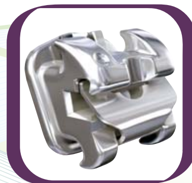
In-Ovation® R : Das Original! Das führende selbstligierende Metallbracket

In-Ovation® – DENTSPLY GAC bietet eine komplette Produktserie bei selbstligierenden Brackets. In-Ovation® Brackets – unübertroffen in Design, Vielseitigkeit, Zuverlässigkeit und Effizienz für präzise Resultate und zufriedene Patienten!