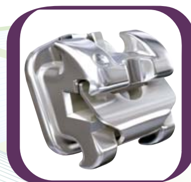
In-Ovation® R : Das Original! Das führende selbstligierende Metallbracket

In-Ovation® – DENTSPLY GAC bietet eine komplette Produktserie bei selbstligierenden Brackets. In-Ovation® Brackets – unübertroffen in Design, Vielseitigkeit, Zuverlässigkeit und Effizienz für präzise Resultate und zufriedene Patienten!