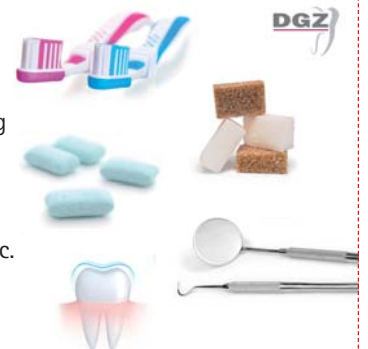
Abb.1: Die DGZ-Empfehlungen liefern einen Prophylaxe-Leitfaden aus einer Hand. – Abb.2: Der „5-Punkte-Plan“ vereint die wichtigsten Tipps für gesunde Zähne.