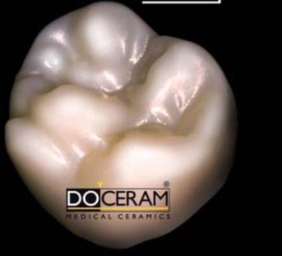
Gefräst, gesintert, nicht charakterisiert.

fügung, der sich durch eine sehr hohe, natürliche Lichtdurchlässigkeit auszeichnet.