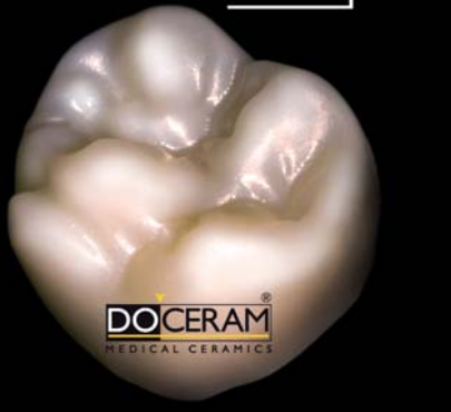
Gefräst, gesintert, nicht charakterisiert.

fügung, der sich durch eine sehr hohe, natürliche Lichtdurchlässigkeit auszeichnet.