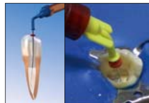
EndoREZ wird mit dem patentierten NavITip (Ø 0,33 mm) blasenfrei von apikal nach koronal eingebracht und füllt die Kanal-Anatomie schnell und sicher.