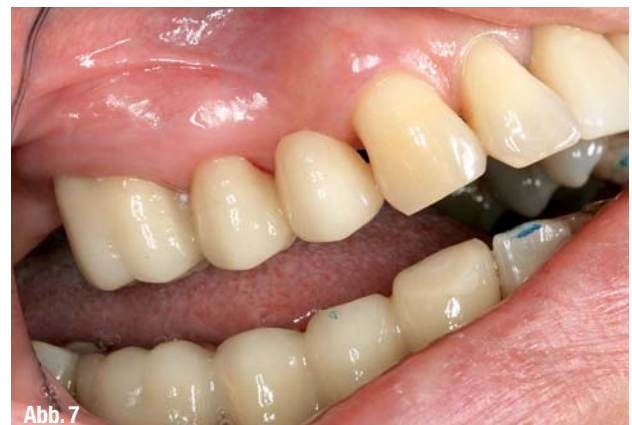
▲ Abb. 6: Brücke aus Lava Plus Zirkoniumoxid. ▲ Abb. 7: Brücke unmittelbar nach dem Zementieren mit RelyX Unicem.