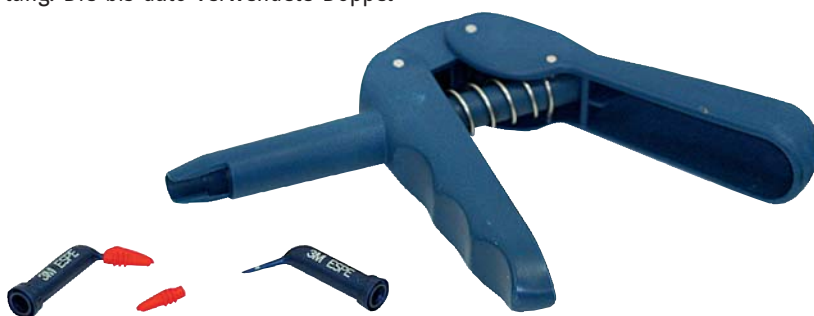
▲ Abb. 1: Die neue adstringierende Retraktionspaste mit dünner flexibler Kanüle.

Die Wahl der Abformtechnik bleibt dem Zahnarzt überlassen. Wir arbeiten seit 25 Jahren ausschließlich mit der Doppelmischtechnik, da wir das Risiko der Kom-