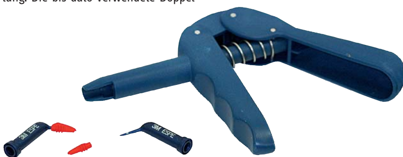
▲ Abb. 1: Die neue adstringierende Retraktionspaste mit dünner flexibler Kanüle.

Die Wahl der Abformtechnik bleibt dem Zahnarzt überlassen. Wir arbeiten seit 25 Jahren ausschließlich mit der Doppelmischtechnik, da wir das Risiko der Kom-