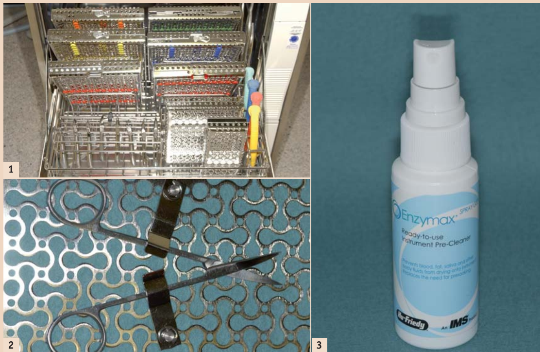
Abb. 1: Die unterschiedlichen Formate des Traysystems im Thermodesinfektor eingebracht. – Abb. 2: Halterungsclips zur Befestigung von einzelnen Instrumenten. – Abb. 3: Enzymax Spray Gel von Hu-Friedy/IMS ersetzt das Einlegen der Instrumentarien.

Das überarbeitete und frisch designte Traysystem von Hu-Friedy fokussiert auf Modularität und Funktionalität. So können diese Trays als Ablagetrays für die Instrumentarien während der Behandlung, als Einlege- und Waschkassetten danach und als Sterilisationskassetten in der Aufbereitung und Lagerung verwendet werden. Durch das neuartige achtförmige Strukturdesign der Kassettenoberfläche, welche ein besseres Durchdringen der Flüssigkeit durch die Kassettenböden und -deckel ermöglicht, wird eine signifikante Verbesserung der Reinigungswirkung der Instrumentarien im Thermodesinfektor erzielt. Die innere Einteilung (Rasterung) lässt sich durch die einstellbaren Zusatzelemente individuell strukturieren und damit auf die spezifischen Bedürfnisse des jeweiligen Trays anpassen. Halterungsclips (Abb. 2) zur Befestigung von einzelnen Instrumenten, wie z.B. Scheren in geöffnetem Zustand, sind ebenfalls vorhanden. Zudem stehen unterschiedliche Traygrößen zur Verfügung: das vollformatige DIN-A4-Normtray, ein etwas kleineres Tray für die Einbringung in konventionelle DIN-Normtrays und Sterilcontainer in DIN-A4-Norm, ein 1/2- sowie ein 1/4-DIN-A4-Normtray. In diesen Trays werden die Instrumente durch farbkodierbare, klemmende Silikonträger in Position gehalten. Der außenliegende Verschlussmechanismus ist sauber integriert und leichtgängig.