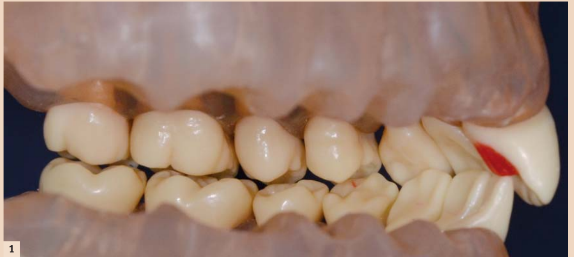
Abb. 1: Frasacomodell mit dem 2. und 3. Quadranten, Plateau an 21 palatinal, Disklusion seitlich.

Die Literatur zeigt, dass Bissserhöhungen von wenigen Millimetern problemlos toleriert werden und somit die Schienenbehandlung in allen Berichten positiv verläuft und nicht notwendig ist, sofern der Patient nicht schon Kiefergelenkssymptome aufzuweisen hat. Beim Austausch der provisorischen Versorgung gegen die definitive sind der Entfernungsbedarf, Nachpräparationsbedarf, das womöglich erneute Herstellen von Zwischenprovisorien sowie die diffizile Bissnahmetechnik sehr aufwendig.