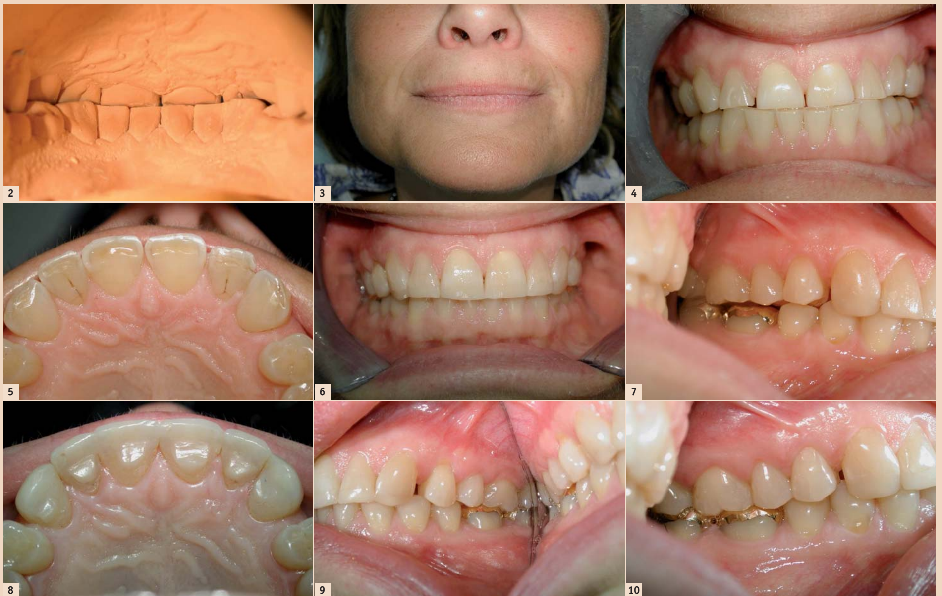
Abb. 2: Frontzahnkontakte in habitueller Okklusion von oral. – Abb. 3: Masseterhypertrophie durch Bruxismus. – Abb. 4: Frontzahnkontakte bei leichter Protrusion. – Abb. 5: TSL an den oberen Frontzähnen palatinal-inzisal. – Abb. 6: Kantenaufbauten unmittelbar postoperativ. – Abb. 7: Seitliche Nonokklusion links unmittelbar nach Plateaus. – Abb. 8: Stabile Frontzahnaufbauten und Plateaus Januar 2014. – Abb. 9: Okklusion rechts, Januar 2014. – Abb. 10: Okklusion links, Januar 2014.

Jeder Zahnarzt kennt die Elongation beschliffener Zähne bei Verlust