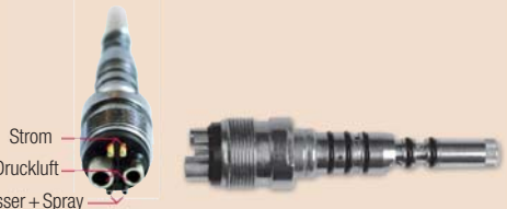
Ident KQD1 Schnell-Kupplung