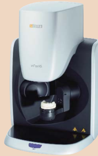
Extraoralscanner inEos X5

Die CEREC Omnicam ermöglicht eine digitale Abformung der Zähne ohne eine vorherige Beschichtung der Zahnoberflächen mit Puder oder Spray. Diese puderfreie Abformung spart Zeit und vereinfacht das Aufnahmeverfahren. Der Zahnarzt führt den Kamerakopf über die Zähne, während sich parallel dazu auf dem Bildschirm eine detaillierte 3D-Abbildung in natürlichen Farben aufbaut. Die hohe Präzision dieser digitalen Daten ermöglicht dem Zahnarzt die Konstruktion eines passgenauen und hochwertigen Zahnersatzes aus Keramik.