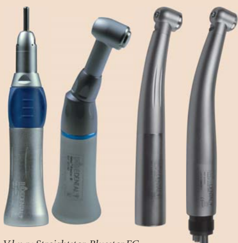
V.l.n.r.: Straightstar, Bluostar EC, Airstar TK01, Airstar TS01