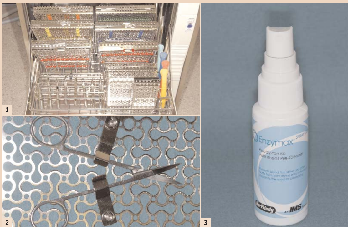
Abb. 1: Die unterschiedlichen Formate des Traysystems im Thermodesinfektor eingebracht. – Abb. 2: Halterungsclips zur Befestigung von einzelnen Instrumenten. – Abb. 3: Enzymax Spray Gel von Hu-Friedy/IMS ersetzt das Einlegen der Instrumentarien.

Das überarbeitete und frisch designte Traysystem von Hu-Friedy fokussiert auf Modularität und Funktionalität. So können diese Trays als Ablagetrays für die Instrumentarien während der Behandlung, als Einlege- und Waschkassetten danach und als Sterilisationskassetten in der Aufbereitung und Lagerung verwendet werden. Durch das neuartige achtförmige Strukturdesign der Kassettenoberfläche, welche ein besseres Durchdringen der Flüssigkeit durch die Kassettenböden und -deckel ermöglicht, wird eine signifikante Verbesserung der Reinigungswirkung der Instrumentarien im Thermodesinfektor erzielt. Die innere Einteilung (Rasterung) lässt sich durch die einstellbaren Zusatzelemente individuell strukturieren und damit auf die spezifischen Bedürfnisse des jeweiligen Trays anpassen. Halterungsclips (Abb. 2) zur Befestigung von einzelnen Instrumenten, wie z.B. Scheren in geöffnetem Zustand, sind ebenfalls vorhanden. Zudem stehen unterschiedliche Traygrößen zur Verfügung: das vollformatige DIN-A4-Normtray, ein etwas kleineres Tray für die Einbringung in konventionelle DIN-Normtrays und Sterilcontainer in DIN-A4-Norm, ein 1/2- sowie ein 1/4-DIN-A4-Normtray. In diesen Trays werden die Instrumente durch farbkodierbare, klemmende Silikonträger in Position gehalten. Der aussenliegende Verschlussmechanismus ist sauber integriert und leichtgängig.