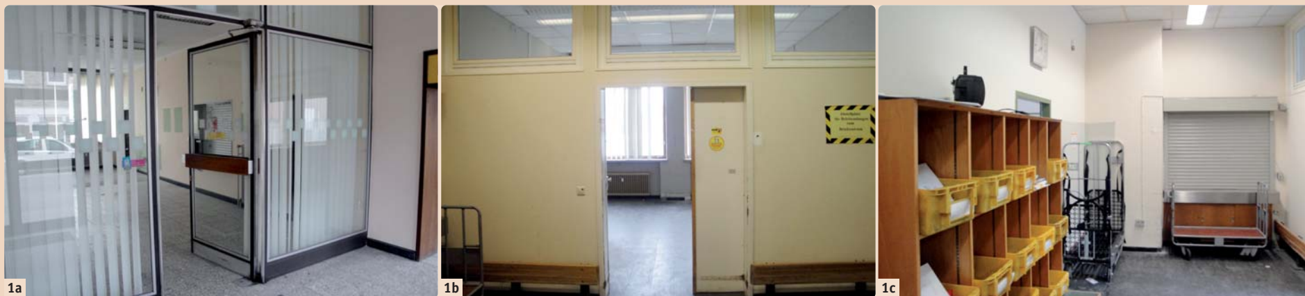
Abb. 1a–c: Vor dem Umbau war die Praxis eine ehemalige Postfiliale.

Bedingt durch die Schließung etlicher Postfilialen wurden in der Vergangenheit bundesweit Räumlichkeiten unterschiedlicher Größenordnungen frei, Leerstände vielerorts vorprogrammiert. Von Christine Kaps.