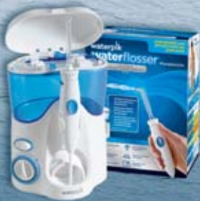
Munddusche Ultra Professional WP-100E4