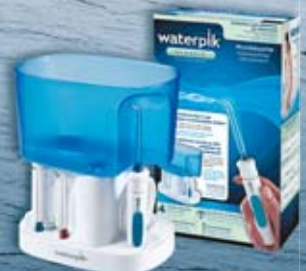
Munddusche Classic WP-70E

In Ergänzung zum täglichen Zähneputzen, unverzichtbar zur wirkungsvollen Vor- und Nachsorge bei Zahnfleiscentzündungen, Zahnfleischtaschen, Parodontitis und Periimplantitis.