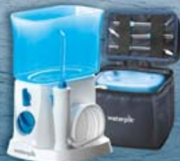
Munddusche Traveler WP-300E