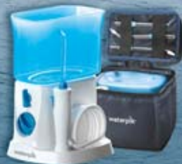
Munddusche Traveler WP-300E