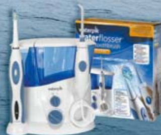
Dental-Center Complete Care WP-900E