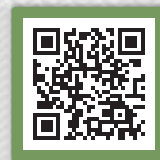
DVD-Vorschau via QR-Code