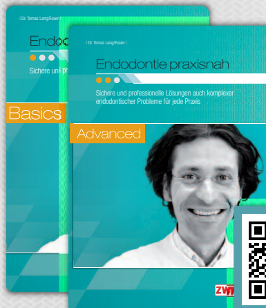
DVDs Endodontie praxisnah – Basics – Advanced | Dr. Tomas Lang/Eszen |