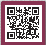
DVD-Vorschau via QR-Code