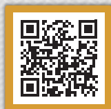
DVD-Vorschau via QR-Code