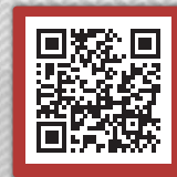
DVD-Vorschau via QR-Code