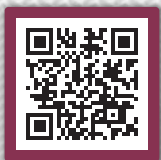
DVD-Vorschau via QR-Code