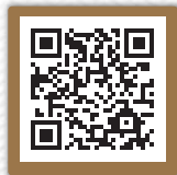
DVD-Vorschau via QR-Code