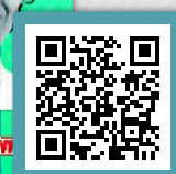
DVD-Vorschau via QR-Code

Bestellformular per Fax an 0341 48474-290