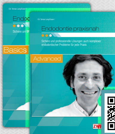
DVDs Endodontie praxisnah – Basics – Advanced | Dr. Tomas Lang/Eszen |