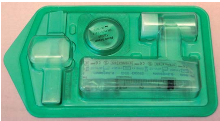
Abb. 1: Der verwendete ICG-Farbstoff perio green® (ellexion, Radolfzell).

Da der Indocyaningrün-Farbstoff (ICG) keine toxische Wirkung hat, wird er in der Medizin sogar intravaskulär angewandt. Für den Zahnmediziner bedeutet dies, dass selbst das eventuelle Verschlucken größerer Mengen während der Anwendung im Mund ohne Folgen bleibt. Wie bei allen Photosensibilisatoren treten keine systemischen Wirkungen auf, und da die Aktivierung mittels Lasers im Milliwattbereich stattfindet, kann die Anwendung delegiert werden.