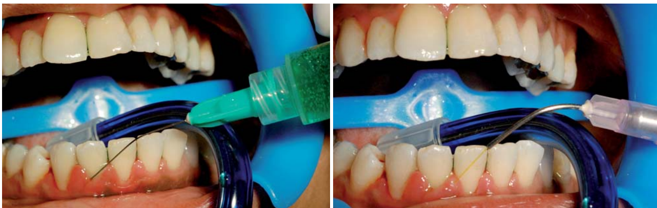
Abb. 2: Applikation der ICG-Lösung in die Parodontaltaschen. – Abb. 3: Laserapplikation.

ICG ist deutlich dünnflüssiger als die „blauen“ Farbstoffe und kann dadurch besser in die Tiefe der Taschen penetrieren. Es erfolgt dabei nur eine Anfärbung der Bakterienmembranen und des entzündeten Gewebes, die umliegenden Bereiche bleiben bei der Anwendung von ICG unbehelligt und unangefärbt. Ein weiterer Vorteil des ICG besteht darin, dass er ein „echter“ photoaktiver Farbstoff ist, d.h. ohne die Aktivierung mittels 810-nm-Laserlicht findet keine Reaktion statt. Eine Eigenaktivität wie bei den „blauen“ Farbstoffen tritt hier nicht auf. Die erzielten Resultate lassen sich also unzweifelhaft auf die photothermische Wirkung des ICG zurückführen.