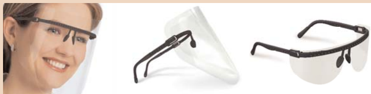
Sterilisierbares schwarzes Vista-Tec-Gestell, mit Gesichts- und Augenschutzschildern verwendbar!

Autoclavable Vista-Tec bietet optimale Funktionalität und besten Tragekomfort.