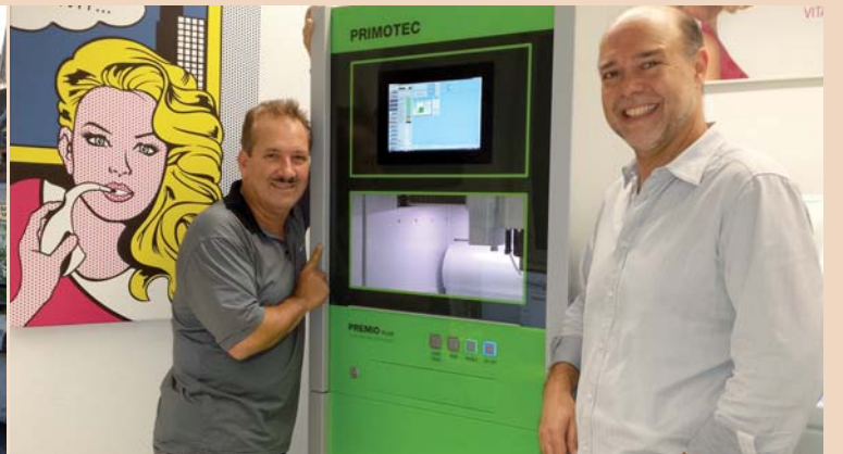
Schwere Maschine braucht grosses Gerät – die Premio Plus, hier noch in der Schutzfolie, ist mit 650 kg kein Leichtgewicht.