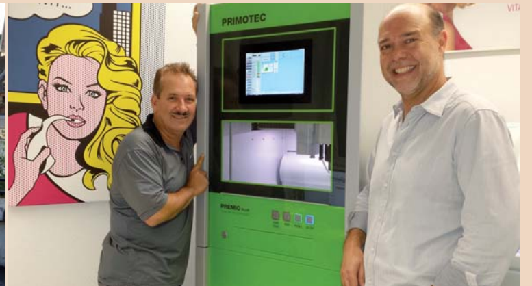
Schwere Maschine braucht grosses Gerät – die Premio Plus, hier noch in der Schutzfolie, ist mit 650 kg kein Leichtgewicht.