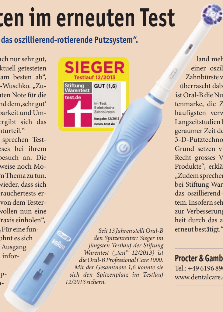
Seit 13 Jahren stellt Oral-B den Spitzenreiter: Sieger im jüngsten Testlauf der Stiftung Warentest („test“ 12/2013) ist die Oral-B Professional Care 1000. Mit der Gesamtnote 1,6 konnte sie sich den Spitzenplatz im Testlauf 12/2013 sichern.

land mehrheitlich zugunsten einer oszillierend-rotierenden Zahnbürste von Oral-B ausfallen, überrascht dabei nicht. Schliesslich ist Oral-B die Nummer-1-Zahnbürstenmarke, die Zahnärzte selbst am häufigsten verwenden. „Klinische Langzeitstudien belegen ja bereits seit geraumer Zeit den Goldstandard der 3-D-Putztechnologie. Aus diesem Grund setzen viele Praxisteam zu Recht grosses Vertrauen in unsere Produkte“, erklärt Starke-Wuschko. „Zudem sprechen sechs Siege in Folge bei Stiftung Warentest eindeutig für das oszillierend-rotierende Putzsystem. Insofern sehen wir unseren Kurs zur Verbesserung der Mundgesundheit durch das aktuelle Testergebnis erneut bestätigt.“ DI