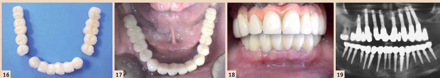
Abb. 16: Definitive Kronenblöcke. – Abb. 17: Okklusalan-sicht. – Abb. 18: Frontalan-sicht. – Abb. 19: Kontroll-OPG ca. vier Jahre post-OP.

Durch das Überdenken allgemeingültiger Implantationsregeln, die überwiegende Verwendung minimalinvasiver Implantationstechniken und einteiliger Implantate ist es möglich, das Ziel schmerzärmer und schneller zu erreichen. Aufgrund der wenigen Arbeitsschritte durch das implantologische Team und das Labor belaufen sich die Kosten dafür, trotz einer wesentlich größeren Implantanzahl, auf 20 bis 50 Prozent unter denen der klassischen Implantologieverfahren. ■