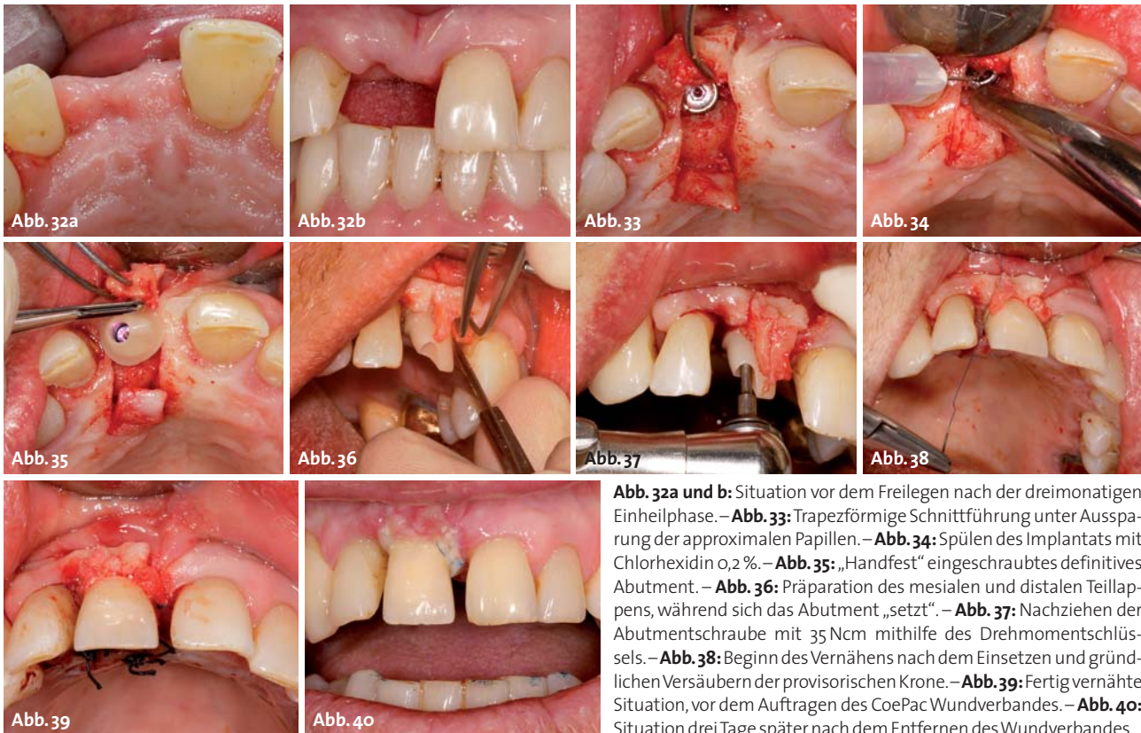
Abb. 32a und b: Situation vor dem Freilegen nach der dreimonatigen Einheilphase. – Abb. 33: Trapezförmige Schnittführung unter Aussparung der approximalen Papillen. – Abb. 34: Spülen des Implantats mit Chlorhexidin 0,2%. – Abb. 35: „Handfest“ eingeschraubtes definitives Abutment. – Abb. 36: Präparation des mesialen und distalen Teillappens, während sich das Abutment „setzt“. – Abb. 37: Nachziehen der Abutmentschraube mit 35 Ncm mithilfe des Drehmomentschlüssels. – Abb. 38: Beginn des Vernähens nach dem Einsetzen und gründlichen Versäuern der provisorischen Krone. – Abb. 39: Fertig vernähte Situation, vor dem Auftragen des CoePac Wundverbandes. – Abb. 40: Situation drei Tage später nach dem Entfernen des Wundverbandes.

werden konnte. Im nächsten Schritt wurden die vier kleinen Unterschnitte ausgeblockt und ein Pattern Resin-Käppchen hergestellt (Abb. 23). Nach der Modellation des Abutments (Abb. 24) wurde dieses nach den Herstellerangaben von Ivoclar angestiftet, eingebettet und im VARIO PRESS 300 e der Firma Zubler mit einem IPS e.max LT Ingot in der Farbe A3 gepresst (Abb. 25). Beim Einbetten empfiehlt es sich, die Konzentration des Einbettmasse liquids um 2–3 ml zu erhöhen, um ein leichteres Aufpassen zu ermöglichen und den Klebspalt etwas zu vergrößern. Dadurch erhöht sich die Pufferzone durch eine stärkere Schicht des Klebekomposits und die Kraftaufnahme beim Kauen kann besser kompensiert werden. Trotz der Gestaltung der Klebebasis mit den vierfachen Rotationschutznuten um die Außenfläche gestaltete sich das Aufpassen schnell und einfach (Abb. 26). Das Verkleben der Variobase-Klebebasis mit dem e.max-Abutment erfolgte mit Multilink-Implant von Ivoclar (optional Panavia F). Wichtig ist hierbei nur, dass der Kleber so opaque wie möglich ist, um das graue Titan optimal zu blocken (Abb. 27–29). Nach dem Verkleben konnte die provisorische Krone hergestellt werden. Hierfür wurde erst ein Dentinkern aus NEW OUTLINE hergestellt, welcher anschließend mit den anaxBLEND-Kompositen individualisiert wurde (Abb. 30). Schließlich wurde noch ein Übertragungsschlüssel aus Pattern Resin angefertigt (Abb. 31).