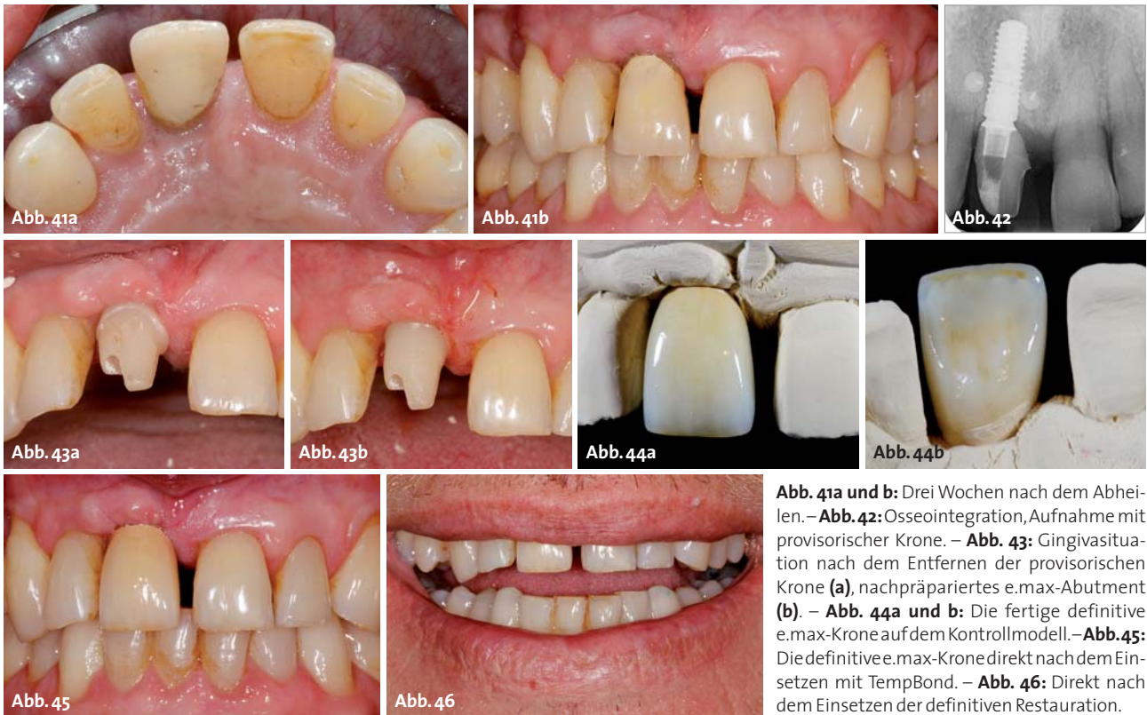
Abb. 41a und b: Drei Wochen nach dem Abheilen. – Abb. 42: Osseointegration, Aufnahme mit provisorischer Krone. – Abb. 43: Gingivasituation nach dem Entfernen der provisorischen Krone (a), nachpräpariertes e.max-Abutment (b). – Abb. 44a und b: Die fertige definitive e.max-Krone auf dem Kontrollmodell. – Abb. 45: Die definitive e.max-Krone direkt nach dem Einsetzen mit TempBond. – Abb. 46: Direkt nach dem Einsetzen der definitiven Restauration.

anschließend mit e.max Ceram verblendet wurde (Abb. 44). Die fertige e.max-Krone wurde auch erst einmal mit TempBond eingesetzt. Aufgrund der weißen, opaquen Farbe von TempBond wirkt sie deshalb auch noch etwas opaquer als Zahn 21, insbesondere im zervikalen Drittel (Abb. 45). Die provisorische Krone wurde nach dem Nachpräparieren des Abutments mit einem Flowkomposit unterfüllt und bis zur Fertigstellung der endgültigen Versorgung wieder eingesetzt.