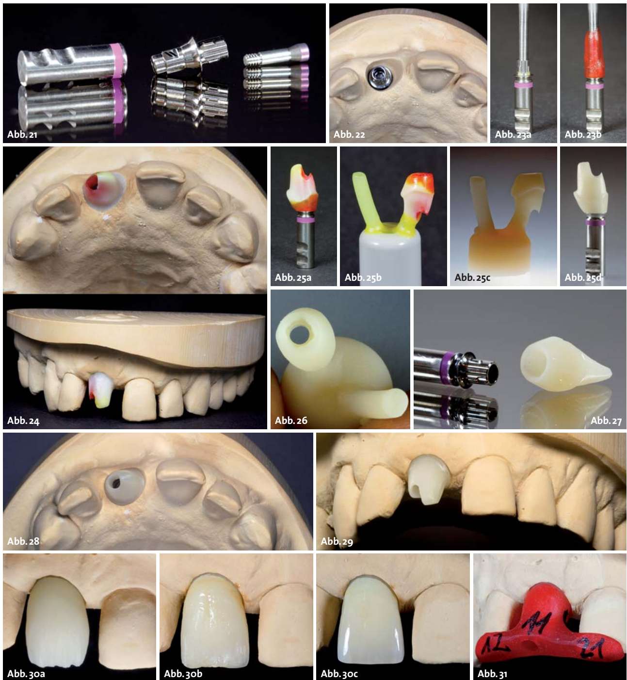
Abb. 21: Die neue Straumann Variobase Titanklebebasis. – Abb. 22: Perfekt ausgeformtes Emergenzprofil, mit eingeschraubter Variobase Titanklebebasis. – Abb. 23: a) Variobase Titanklebebasis mit selbst angefertigter Schraubenkanalverlängerung und ausgeblockten unterschritten (siehe grünes Wachs); b) aus Pattern Resin hergestelltes Käppchen als Basis für die Wachsmodellation des Abutments. – Abb. 24: Fertig modelliertes Abutment von okklusal und vestibulär. – Abb. 25: Ansicht des modellierten Abutments auf der Variobase Titanklebebasis (a) , zum Einbetten fertig angestiftet (b) , fertig ausgebettet (c) und das aufgepasste und ausgearbeitete Abutment fertig zum Verkleben (d) . – Abb. 26: Close-up des e.max-Abutments nach dem Pressen und Ausbetten, die Rotationsschutznuten sind sehr gut zu erkennen. – Abb. 27: Das fertige e.max-Abutment vor dem Verkleben. – Abb. 28: Ansicht des eingeschraubten e.max-Abutments von okklusal auf der Modellation. – Abb. 29: Ansicht von vestibulär. – Abb. 30: Herstellung der provisorischen Krone, a) der Dentinkern aus NEW OUTLINE, b und c) individualisiert und fertiggestellt mit anaxBLEND. – Abb. 31: Übertragungsschlüssel aus Pattern Resin.