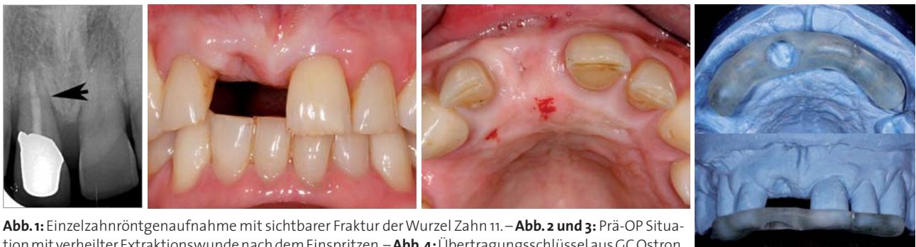
Abb. 1: Einzelzahnrontgenaufnahme mit sichtbarer Fraktur der Wurzel Zahn 11. – Abb. 2 und 3: Prä-OP Situation mit verheilter Extraktionswunde nach dem Einspritzen. – Abb. 4: Übertragungsschlüssel aus GC Ostron.

Während der dreimonatigen Einheilphase erfolgte im Labor die Herstellung des Abutments und der provisorischen Krone. Auf diesen Ablauf soll etwas genauer eingegangen werden.