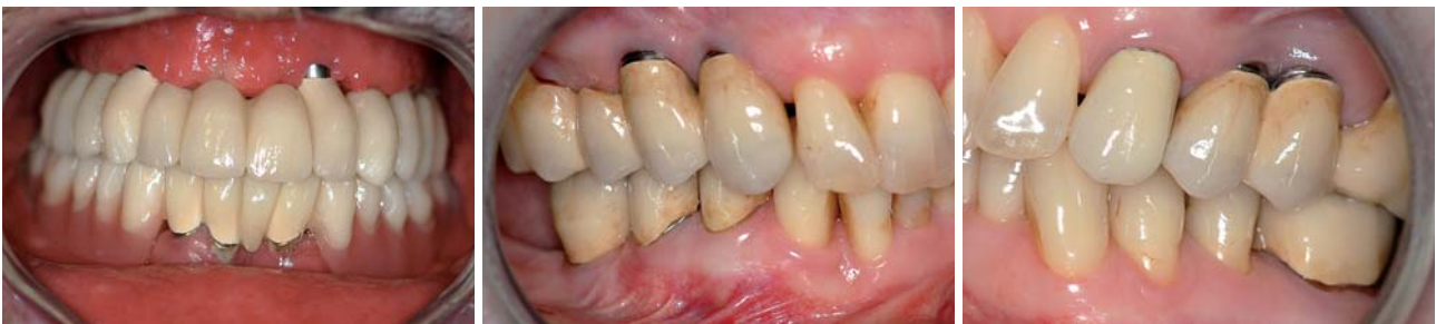
Abb. 1: Im Frontzahnbereich Regio 13 und 22 sichtbare „Titananknie“. – Abb. 2a und b: Nach achtjähriger Tragedauer sichtbar gewordene Titanabutments Regio 14, 13, 24, 25.

Ein Faktor, der langfristig unberechenbar bleibt, ist das Verhalten der Weichteile. Wenn sich aus welchen Gründen auch immer die fixierte Gingiva zurückzieht, kommen die Abutments zum Vorschein. Ob Titan- oder Zirkonoxidaufbauten – gerade im sichtbaren Bereich ist das eine nicht zufriedenstellende Situation (Abb. 2a und b). Darüber hinaus haben wir hier genau wie bei