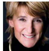
ZTM von Hajmasy