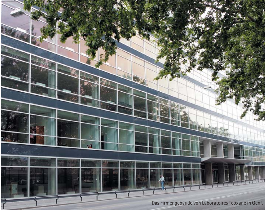
Das Firmengebäude von Laboratoires Teoxane in Genf.