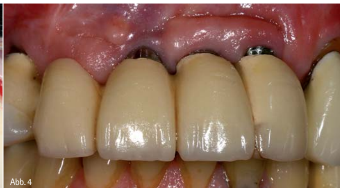
Abb. 3: Insertion von zwei ANKYLOS plus-Implantaten (DENTSPLY Friadent, Mannheim) mit Einhaltung ausreichender interimplantärer Abstände und einer ausreichenden zirkulären Knochenbedeckung. – Abb. 4: Insbesondere Implantate, die ursprünglich für eine transgingivale Einheilung konzipiert sind, zeigen ein erhöhtes Risiko der Exposition störender metallischer Ränder. Der ästhetische Misserfolg wird im vorliegenden Fall durch die Passungsmängel der verblockten Suprakonstruktion noch verstärkt.