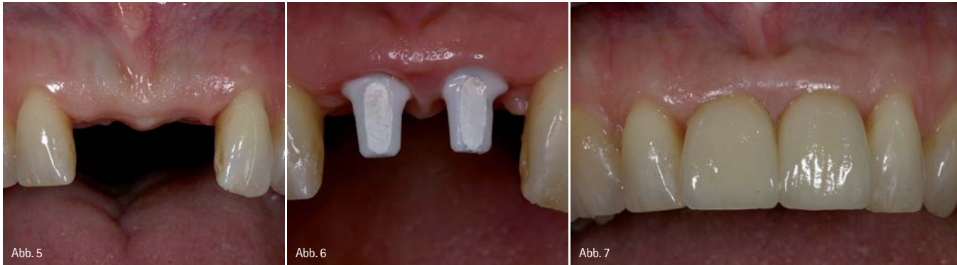
Abb. 5: Ausgangssituation nach Verlust der beiden mittleren Frontzähne. Die Interdentalpapille ist durch die Versorgung mit einem abnehmbaren Interimsersatz weitgehend zerstört. – Abb. 6: Zustand nach umfangreicher Weichgewebsaugmentation und Insertion von zwei Implantaten mit vollkeramischen Aufbauten (Cercon Balance, DENTSPLY Friadent, Mannheim). – Abb. 7: Insertion der vollkeramischen Suprakonstruktion (Cercon Smart Ceramics, DeguDent, Hanau) mit verlängerter approximaler Kontaktlinie zum Verschluss der approximalen Zwischenräume.

tieren. Auf der Basis der vorliegenden Untersuchungen führt dabei das Platform Switching zu einer verbesserten Stabilität der periimplantären Hart- und Weichgewebe. Eine laststabile und bewegungsfreie Verbindung von Implantat und -aufbau, wie sie durch konusförmige Verbindungen erreicht werden kann, ist ein weiteres positives Konstruktionsmerkmal zum Erhalt der periimplantären Hart- und Weichgewebe. Abgesehen vom Implantatdesign sollten für festsitzende Versorgungen im Frontzahnbereich auch präfabrizierte vollkeramische Abutments auf Zirkonoxid zur Verfügung stehen. Zirkonoxid-Abutments haben eine deutliche höhere Bruchfestigkeit als die schon seit längerer Zeit bekannten Vollkeramikaufbauten aus Aluminiumoxid. Dies reduziert das Risiko einer Abutmentfraktur.