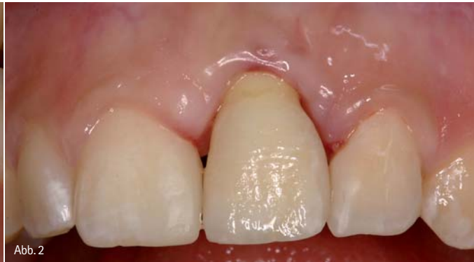
Abb. 1: Falsche Positionierung eines Frontzahn-Implantates mit zu weit bukkal liegendem Durchtrittspunkt und Verlust der vestibulären Knochenlamelle mit Rezession der Weichgewebe. – Abb. 2: Insbesondere im Frontzahnbereich lassen sich Positionierungsfehler nur in geringem Umfang durch die Suprakonstruktion korrigieren. In diesem Fall liegt ein klarer ästhetischer Misserfolg vor.

nur sehr schwer korrigiert werden (Abb. 1 und 2). Darüber hinaus ist bei der Planung zu berücksichtigen, dass für einen langfristigen Implantaterfolg entsprechende interimplantäre Mindestabstände und Abstände zu den Nachbarzähnen einzuhalten sind (Abb. 3). Langfristige ästhetische Behandlungsergebnisse können nur erreicht werden, wenn das periimplantäre Weichgewebe ausreichend durch eine knöcherne Unterlage stabilisiert wird. Hierbei ist im Frontzahnbereich der Erhalt der Interdentalpapille von zentraler Bedeutung. Der Erhalt oder die Regeneration einer Papille zwischen zwei Implantaten stellt eine besondere Herausforderung dar. Diese bekannte Problematik sollte insbesondere bei der Planung einer implantatprothetischen Versorgung zum Ersatz der beiden mittleren oberen Frontzähne berücksichtigt werden. Weniger kritisch ist der Papillenerhalt im Bereich zwischen einem Implantat und einem natürlichen Zahn. Die Resorption der bukkalen Knochenlamelle mit der nachfolgenden Ausbildung einer Weich-