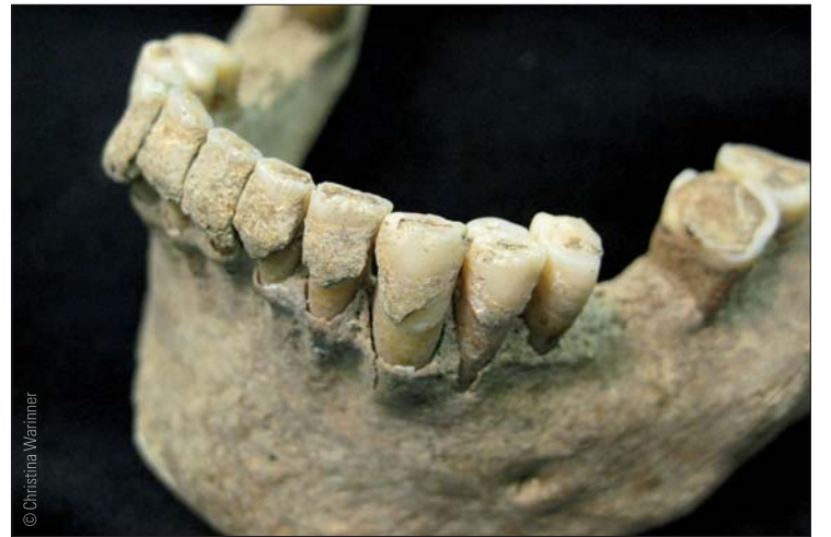
Zahnstein bei einem Mann, der im Mittelalter in Dalheim lebte.

Wie sich weiter herausstellte, besaß die mittelalterliche Mund-