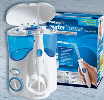
Waterpik® Munddusche Ultra Professional WP-100E4