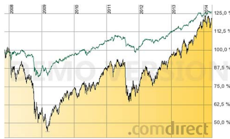
Grüne Linie: KR Fonds Deutsche Aktien Spezial, schwarze Linie: C-DAX.

Vor ziemlich genau einem Jahr lästerte ich in der ZWP 3/2013 ordentlich über eine „Insider-Report-Pflichtlektüre“, die für meinen Geschmack viel zu positiv über eine „Sachwertanlage“ in kanadischen Öl- und Gasfeldern berichtete. Leider hatte ich mal wieder mit meinen Prognosen recht, denn die „interessante Anlage zwecks Portfolioergänzung“ von Proven Oil Canada (POC) kristallisiert sich immer mehr als Flop heraus. Inzwischen bleiben die versprochenen Ausschüttungen aus und ich vermute, es wird nicht mehr lange dauern, bis auch dem letzten mutigen Investor klar ist, dass sein Geld für immer weg sein wird. Die Anwalts-Geier, die den geschädigten Anlegern versprechen, dass sie ihnen ihr ganzes Geld vom Vermittler zurückklagen werden, sind schon aufgestiegen und kreisen über ihren Opfern. Ich befürchte allerdings, dass diese Prozesse der zweite Flop für die Anleger werden, weil von den allermeisten Vermittlern, die diese Anlage empfohlen haben, nichts zu holen sein wird.