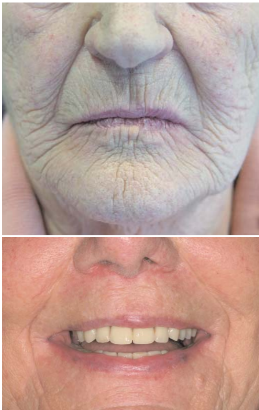
Abb. 1: 80-jährige Patientin, Lippenalterung, Mittel- und Untergesichtsfalten, Ptosis, leichter Hirsutismus Oberlippe. – Abb. 2: 64-jährige Patientin, Lippenalterung, Faltenbildung, sichtbare Unterkieferfront.

Die Ptosis von Bindegewebs- und Fettstrukturen des Gesichtes stellt ein all-