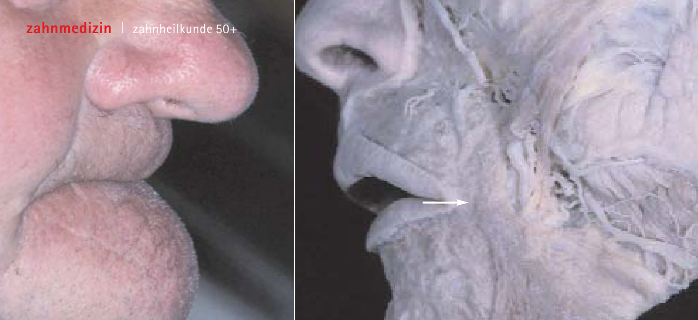
Abb. 3: 75-jähriger Patient, Profil bei Zahnlosigkeit, Ptosis Nasenspitze. – Abb. 4: Anatomisches Präparat der seitlichen oberen Gesichtszion, Pfeil: Modiolus.

gemeines Phänomen der Weichgewebsalterung dar. Es handelt sich dabei um ein Absinken von Gewebe (Deszenus) durch die Einwirkung der Schwerkraft. Ursachen sind die im Alter nachlassenden Rückhaltekräfte des muskulär-aponeurotischen Systems der mimischen Muskeln und der subkutanen Septen und Haltebänder. Dies führt z.B. zur Bildung von „Tränensäcken“ durch nach anterior deszendierendes Orbitafettgewebe, zu „Hängebacken“ durch absteigendes Wangen- und submandibuläres Fett oder zum „Doppelkinn“ durch absinkendes submentales Fettgewebe (Abb. 1). Auch die Augenbrauenregion und die Augenlider unterliegen einer Ptosis. Ein anderes pathogenetisches Konzept der Weich-