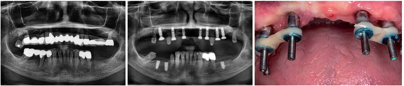
Abb. 3: Anfangsbefund mit stark parodontal vorgeschädigter Restbezaehlung. – Abb. 4: Situation nach Insertion der Implantate im Ober- und Unterkiefer. – Abb. 5: Intraorale Verblockung der Abformpfosten mit einem lichthärtenden Komposit zur verbesserten Fixierung im Abformmaterial.

2007). Eine zufriedenstellende Passung konnte erst durch zahntechnische Nachbearbeitung (Trennen und Fügen durch Löten oder Schweißen, Funkenerosion oder intraorale Verklebung mit präfabrizierten Implantatkomponenten) erreicht werden. CAD/CAM-gefertigte Brückengerüste zeigten demgegenüber eine gleichbleibend hohe Passungsqualität. Ihre Herstellung erwies sich wesentlich weniger techniksensitiv als die gusstechnische Fertigung von Titan- oder CoCr-Brückengerüsten (Torsello et al. 2008, Abduo et al. 2011).