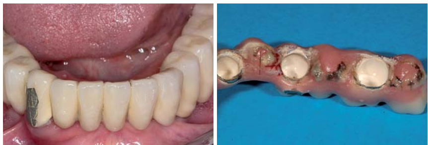
Abb. 1: Keramikfraktur an einer alio loco gefertigten und zementierten, mehrgliedrigen Brücke nach achtmonatiger Tragedauer. – Abb. 2: Verstärkte Ablagerungen an einer provisorisch zementierten, mehrgliedrigen, implantatgestützten Brücke nach zwölfmonatiger Tragedauer.

Über einen langen Zeitraum wurden verschraubte, implantatgestützte Brückengerüste aus Edelmetalllegierungen im Gussverfahren hergestellt (Attard 2004). Diese Herstellungstechnik liefert eine vorhersagbare Passungsqualität (Abduo et al. 2011). Aus ökonomischen Gesichtspunkten wäre jedoch eine Fertigung aus einem möglichst biokompatiblen Werkstoff mit ausreichender mechanischer Festigkeit wie zum Beispiel Reintitan oder einer CoCr-Legierung sinnvoll. Die Verarbeitung dieser Alternativwerkstoffe bietet jedoch gusstechnisch keine ausreichende Passgenauigkeit. In-vitro-Untersuchungen an gegossenen Implantatsuprastrukturen aus nichtedelmetallischen Werkstoffen zeigten zwischen Suprastruktur und Implantataufbau mittlere Spalten im Bereich von 200–230 µm (De-Torres et al.