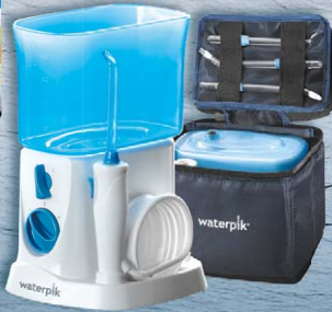
Waterpik® Munddusche Traveler WP-300E