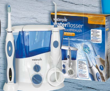
Waterpik® Dental-Center Complete Care WP-900E