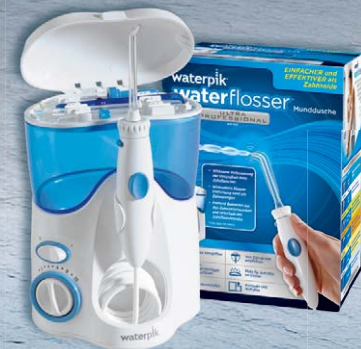
Waterpik® Munddusche Ultra Professional WP-100E4