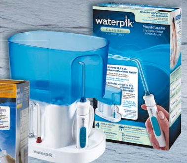
Waterpik® Munddusche Classic WP-70E

Waterpik® – die Nr. 1 unter den Mundduschen.