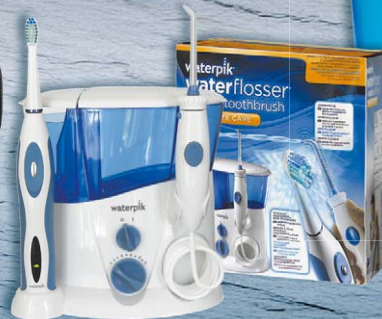
Waterpik® Dental-Center Complete Care WP-900E