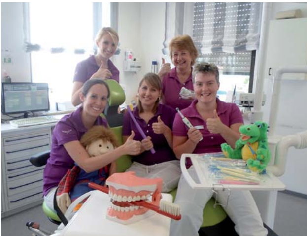
Abb. 1: Das Team der „Praxis für Zahnheilkunde Mauer“.

■ Wir als Zahnarztpraxis beteiligen uns an den verschiedenen Sammelprogrammen von TerraCycle – besonders erfolgreich sind wir beim Sammeln von Zahnhygieneartikeln wie alten Zahnbürsten oder leeren Zahnseidedöschen für das Colgate Sammelprogramm. Pro Abfalleinheit, die wir an TerraCycle schicken, werden uns Punkte gutgeschrieben, die wir in eine Bargeldspende für ein gemeinnütziges Projekt umwandeln können.