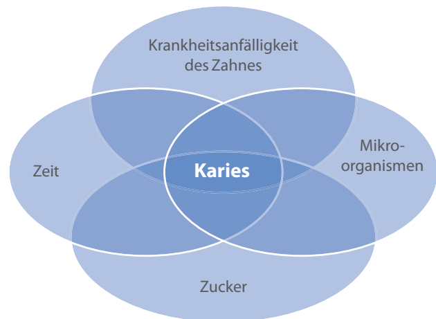
Abb. 1: Notwendige Faktoren für die Entstehung einer Karies (nach Zimmer 2000).

Generell hat es sich bewährt, die Zähne mindestens zweimal täglich (ADA 2006, DGZMK 2007) mit einer höchstens drei bis vier Monate alten (ADA 2007) Kurzkopfbürste mit abgerundeten (Imfeld und Lutz 1995) mittelharten Kunststoffmonofilen und engem Bündelabstand