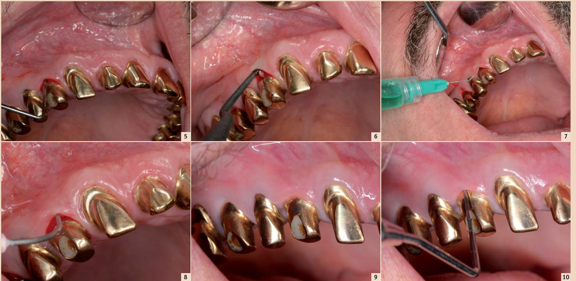
Patientenfall – Abb. 5: Implantat 14 mit Periimplantitis, Sondierungstiefe bis zu 5 mm, geschwollene Gingiva, rötliches Colorit, positives Bleeding on Probing. – Abb. 6: Geschlossene Kürettage, Entfernung der subgingivalen Konkremente. – Abb. 7: Applikation der Perio Green-Lösung. – Abb. 8: Aktivierung des Indocyaningrüns mittels Laser nach Ausspülen des überflüssigen Farbstoffes. – Abb. 9: Situation nach zweimaliger Behandlung im Abstand von vier Wochen, drei Monate nach der zweiten Behandlung. Es zeigt sich eine physiologische Gingiva von normalem Colorit und ohne Schwellung. – Abb. 10: Situation wie in Abb. 9, kein positives BOP.

sehr wenige beschrieben. Trotzdem ist ein Einsatz bei bekannter Jodallergie aufgrund des jodhaltigen Indocyaningrün eher zurückhaltend zu betrachten.