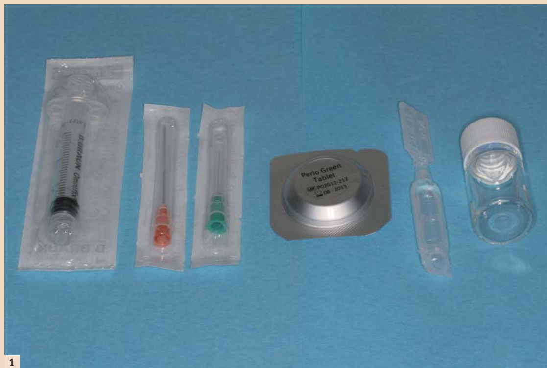
Abb. 1: Packungsinhalt mit Applikationsspritze, Aspirationskanüle, Applikationskanüle, Perio Green-Tablette, sterilem Wasser sowie Mischbehältnis.

Das Wirkungsprinzip der photodynamischen Keimreduktion oder photodynamischen Therapie beruht auf Einbringung eines Farbstoffes in parodontale Taschen, der dann mittels einer Lichtquelle aktiviert wird und somit seine bakterizide Wirkung entfalten kann. Das Indocyaningrün (Perio Green)