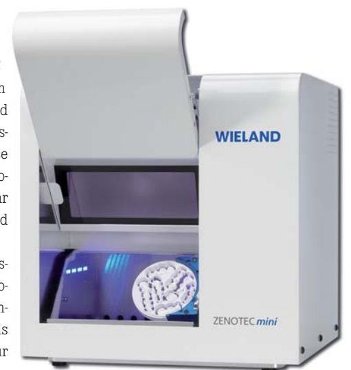
• ZENOTEC mini

Tel.: +43 1 26319 11-0 www.ivoclarvivadent.at Stand: C03