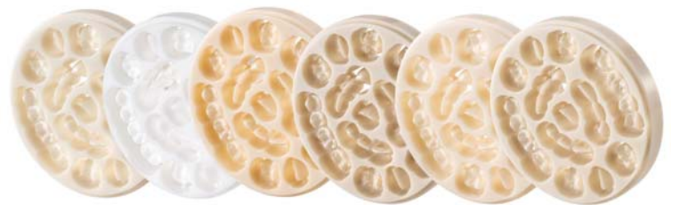
• Zenostar Zr Translucent pure, light, medium, intense, sun, sun chroma.

Gut gerüstet für alle Arbeiten im Labor.