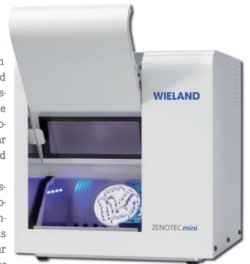
• ZENOTEC mini

Tel.: +43 1 26319 11-0 www.ivoclarvivadent.at Stand: C03