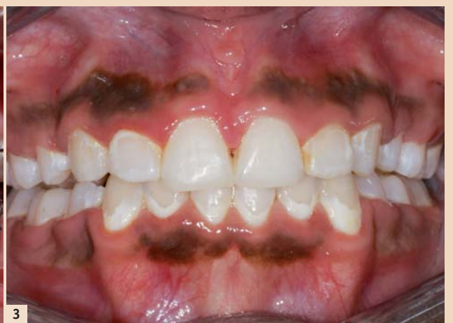
Abb. 1: Multibracketapparaturen stellen Hygienehindernisse dar und begünstigen eine vermehrte Plaqueakkumulation. – Abb. 2: Unzureichende Pflege- und Fluoridierungsmaßnahmen erhöhen das Schmelz-Demineralisationsrisiko und führen rasch zu White-Spot-Läsionen. – Abb. 3: White-Spot-Läsionen werden von vielen Patienten oftmals erst nach Entfernung der Brackets als ästhetisch störend wahrgenommen.

lässig vermeiden, was mit der Dynamik der WSL-Formation zusammenhängt: Obwohl es erwiesen ist, dass besonders lang andauernde Bracketbehandlungen die Entstehung von WSL signifikant begünstigen, können initiale Schmelzdemineralisationen bereits nach sehr kurzen Behandlungszeiträumen von nur wenigen Wochen oder Monaten auftreten.