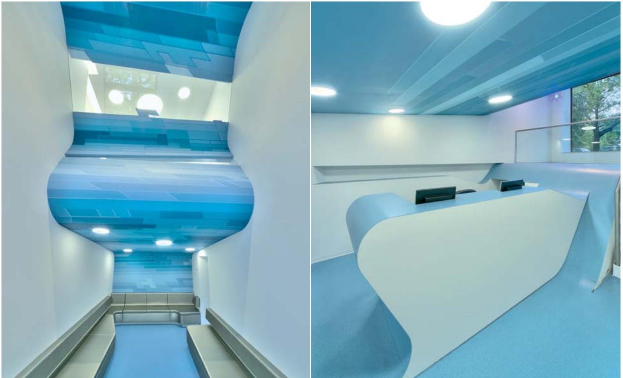
Abb. 4 und 5: Wellenformen erinnern in der Praxis von Dr. Mokabberi an eine Unterwasserwelt.

bei die Funktionen von Decke, Wand, Counter und Sitzlounge übernimmt. Es entsteht so ein Raumgefüge, bei dem die Räume durch die Gestik der Welle ineinander verwoben werden. Die Ausbildung von Splitslevels lässt einen beim Eintreten unter die Welle tauchen und jeder Patient wird sogleich in die Unterwasserwelt gezogen, die durch wandfüllende Grafiken eine atemberaubende Atmosphäre erzeugt. In allen Bereichen der Praxis ist das Thema präsent und wird durch den spezifischen Einsatz von Licht und Materialien erlebbar. Das Lichtkonzept unterstreicht den Eindruck der Unterwasserwelt durch