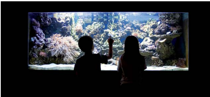
Abb. 1: In der „Milchzahn“-Praxis können Kinder ein Salzwasser-Aquarium bestaunen.

Die Architektur von Arztpraxen spricht häufig dieselbe Sprache: es ist eine Ästhetik der Hygiene und Sterilität. Unterstützt