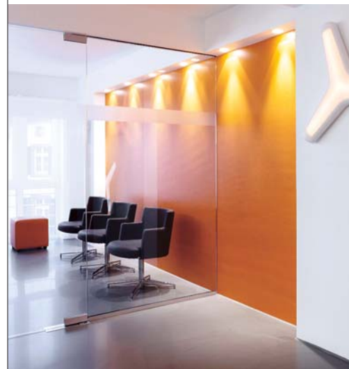
Planung Design Abwicklung