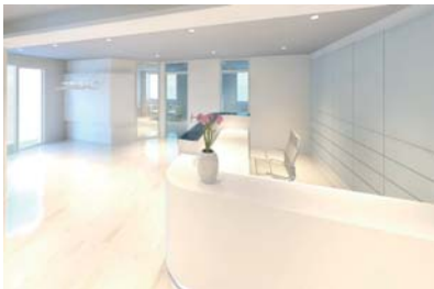
Abb. 4: Entwurf eines Wartezimmers.