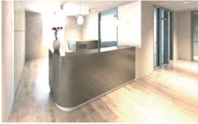
Abb. 2: Entwurf des Empfangsbereiches.