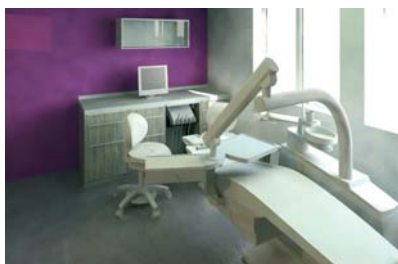
Abb. 3: Entwurf eines Prophylaxezimmers.