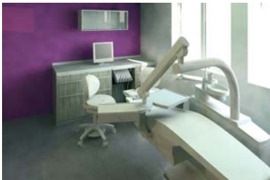
Abb. 3: Entwurf eines Prophylaxezimmers.