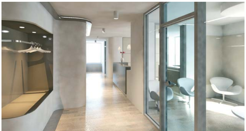
Abb. 1: Entwurf eines Praxis-Eingangsbereiches.

Bereits seit mehr als zwei Jahren setzt Bauer & Reif eine ausgefeilte 3-D-Architekten-Planungssoftware für die Neugestaltung von Praxisräumen ein. Auf einer modernen Großbildleinwand können die Auftraggeber den kreati-