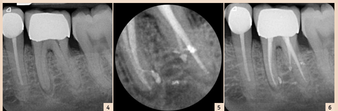
Abb. 4–6: Die Abbildungen zeigen, wie schwierig es anhand von Röntgenaufnahmen ist, komplizierte Fälle zu detektieren. Auf der ersten Aufnahme (Abb. 4) sind der mesiale und der distale Kanal gut sichtbar. Die apikale Parodontitis imponiert im mesialen Kanalsystem und ist diskret im distalen Kanalsystem sichtbar. Hier hat der Überweiser sich nach der dritten Behandlungssitzung ohne Erfolg auf eine Besserung der Beschwerden mit konventioneller Wurzelkanalbehandlung zur Überweisung entschieden. Intraoperativ zeigte sich eine Radix entomolaris mit einem Kanaleingang weit lingual neben dem distalen Kanaleingang. Der Patient ist nach der ersten Sitzung beschwerdefrei geworden.

In drei aufeinander aufbauenden Modulen – Basiskurs, Fortgeschrittenkurs und Masterclass – der Kursreihe Endodontie bildet Dr. Lang Zahnärzte aus. Bei diesen Fortbildungen tauchen sehr häufig Fragen in Bezug auf postoperative Beschwerden und das Schmerzmanagement bei der Wurzelkanalbehandlung auf. Einige der häufigsten Fragen haben wir hier zusammengetragen.