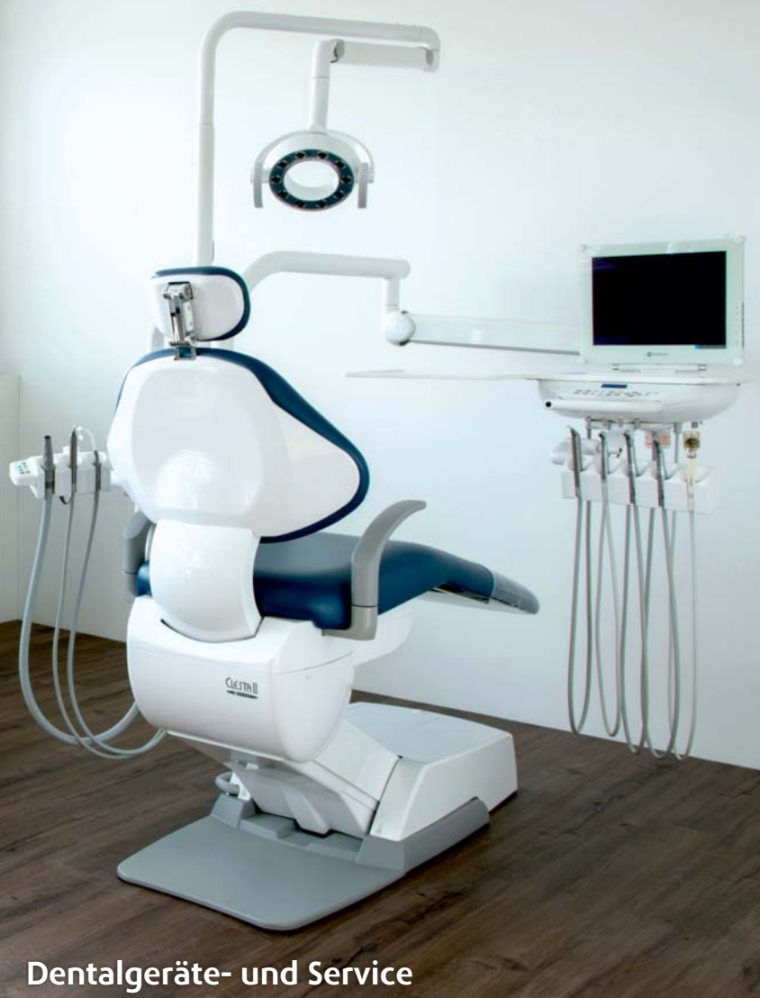
Dentalgeräte- und Service