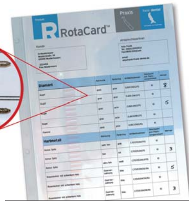
Abb. 4: Um bedarfsgerechtes Ordern dauerhaft praktikabel zu machen, bietet Frank Dental kostenfreie Serviceleistungen, wie z.B. die RotaCard™.

auch im Unternehmen. So entwickelten wir z.B. das kostenfreie und zeitsparende Bestellmanagement RotaCard™ und RotaBox™. Die Zahnarztpraxis oder das Labor schickt uns einfach die am häufigsten verwendeten abgenutzten Diamanten, HM-Bohrer, Polierer etc. zu. Anhand der abgenutzten Instrumente erstellen unsere Mitarbeiter eine detaillierte Kol-