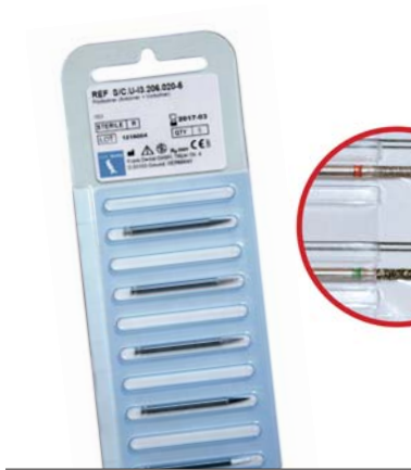
Abb. 3: Der Dreikant-Pilotbohrer wird steril verpackt geliefert, ist mehrfach verwendbar und einfach zu sterilisieren. Er ist für alle Implantatsysteme anwendbar.

auch im Unternehmen. So entwickelten wir z.B. das kostenfreie und zeitsparende Bestellmanagement RotaCard™ und RotaBox™. Die Zahnarztpraxis oder das Labor schickt uns einfach die am häufigsten verwendeten abgenutzten Diamanten, HM-Bohrer, Polierer etc. zu. Anhand der abgenutzten Instrumente erstellen unsere Mitarbeiter eine detaillierte Kol-