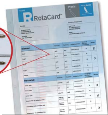
Abb. 4: Um bedarfsgerechtes Ordern dauerhaft praktikabel zu machen, bietet Frank Dental kostenfreie Serviceleistungen, wie z.B. die RotaCard™.

auch im Unternehmen. So entwickelten wir z.B. das kostenfreie und zeitsparende Bestellmanagement RotaCard™ und RotaBox™. Die Zahnarztpraxis oder das Labor schickt uns einfach die am häufigsten verwendeten abgenutzten Diamanten, HM-Bohrer, Polierer etc. zu. Anhand der abgenutzten Instrumente erstellen unsere Mitarbeiter eine detaillierte Kol-