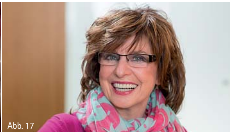
Abb. 9: Virtuelle Konstruktion des Brückengerüsts mit konventioneller, zentraler Verschraubung. Die vestibuläre Lage der Schraubenzugangsöffnungen führt zu ästhetischen Beeinträchtigungen. – Abb. 10: Modifiziertes Design mit der für das cara I-Bridge-System spezifischen Abwinkelung der Schraubkanäle um bis zu 20°. Auf diese Weise konnten alle Zugangsöffnungen in ästhetisch unkritische Bereiche verlagert werden. – Abb. 11: Übersichtsdarstellung des per E-Mail versandten Designvorschlags für die Brückenkonstruktion. – Abb. 12: Detailansicht des aus einer CoCr-Legierung gefrästen Brückengerüsts. – Abb. 13: Einprobe des gefrästen Brückengerüsts zur Überprüfung von passivem Sitz und korrekter Bisslage. – Abb. 14: Basalansicht des fertig verblendeten Brückengerüsts. Die Suprakonstruktion wurde unter Verwendung des Silikon Schlüssels der bereits vorhandenen Zahnaufstellung verblendet. – Abb. 15: Fertiggestellte, verschraubte Implantatbrücke. – Abb. 16: Fertiggestellte, verschraubte Implantatbrücke in der Frontalansicht. – Abb. 17: Zufriedene Patientin. (Abb. 9 und 10 zeigt Teilausschnitt des Software-Screen)

Fall wurden diese Daten aus der Interimsversorgung übernommen. Die Zahnaufstellung, die im Wesentlichen auf den Informationen der Planungs- und Röntgenschablone beruht, wird beim nächsten Behandlungstermin einprobiert und gegebenenfalls korrigiert. So kann eine exakte Kieferrelationsbestimmung durchgeführt werden und es liegen ausreichende Informationen für die definitive Zahnaufstellung vor. Die Präzision der Abformung mit einem Übertragungsschlüssel sollte ebenfalls in diesem Termin überprüft werden. Für diesen Schlüssel können die Übertragungspfeile auf dem Arbeitsmodell mit Kunststoff und einer Metallverstärkung verblockt werden. Er muss auf den Implantaten im Mund spannungs- und bewegungsfrei passen. Im vorliegenden