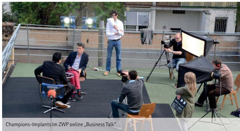
Champions-Implants im ZWP online „Business-Talk“!

tige Marktsituation ein und welche Hauptentwicklungsrichtungen sind Ihrer Meinung nach erkennbar?