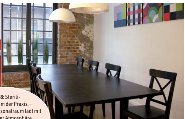
Abb. 8: Sterilisationsraum der Praxis. – Abb. 9: Der Personalraum lädt mit gemütlicher Atmosphäre zum Aufenthalt ein. (Depot: Plura-dent Bonn, Möbelausstatter: Mann Möbel)