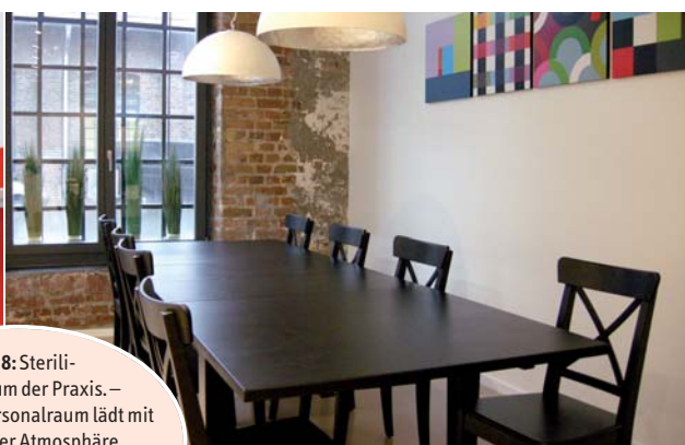
Abb. 8: Sterilisationsraum der Praxis. – Abb. 9: Der Personalraum lädt mit gemütlicher Atmosphäre zum Aufenthalt ein. (Depot: Plura-dent Bonn, Möbelausstatter: Mann Möbel)