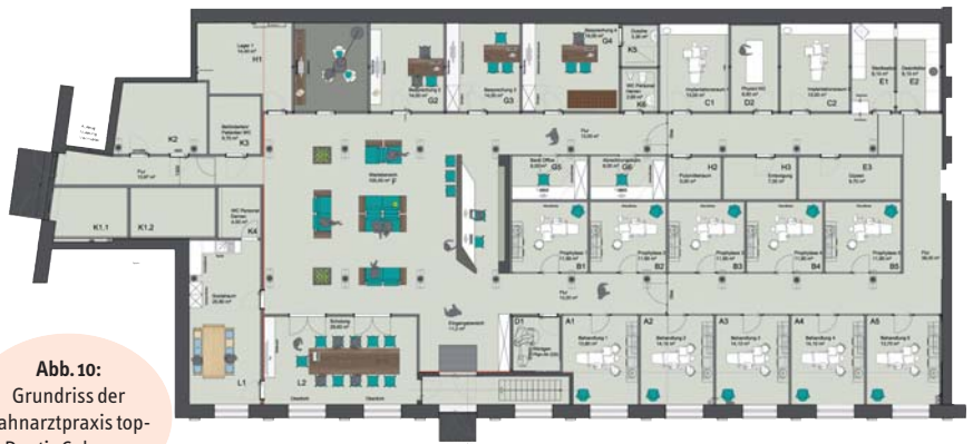
Abb. 10: Grundriss der Zahnarztpraxis topDentis Cologne.

Seit der Eröffnung haben wir einen tollen Zuspruch der Patienten, welche sich in dem Ambiente ausgesprochen wohlfühlen. Besonders wird das Zusammenspiel von alter Bau- substanz und den neu integrierten Räumen gelobt sowie der erhaltene Loftcharakter.