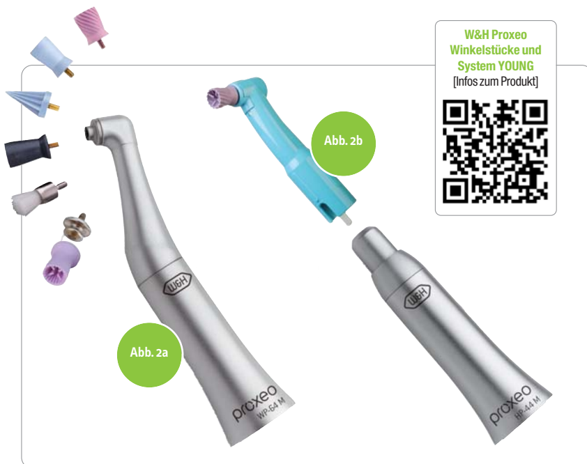
Abb. 1a, b: Dank des kleinen Winkelstückkopfes sind auch die schwer einsehbaren Behandlungsfelder im distalen Bereich jederzeit bestens im Blick. – Abb. 2a, b: Proxeo bietet zwei Systeme zum Reinigen, Polieren oder Fluoridieren. Das System UNIVERSAL (a) funktioniert mittels Screw-in- oder Snap-on-Technik, während das System YOUNG auf Einwegwinkelstücke setzt (b).