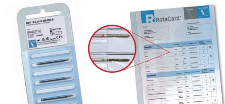
Der Dreikant-Pilotbohrer wird steril verpackt geliefert, ist mehrfach verwendbar und einfach zu sterilisieren. Er ist für alle Implantatsysteme anwendbar.

Das ist sehr einfach. Wir sind per Telefonat oder Mail für jede Idee offen. Gleichgültig welche Geometrie, Schnittfreudigkeit oder individuelle Beschichtung – nach der gemeinsamen Definition des Anforderungsprofils entwickeln wir in ca. drei Monaten ein maßgeschneidertes Produkt. Diesen Service bieten