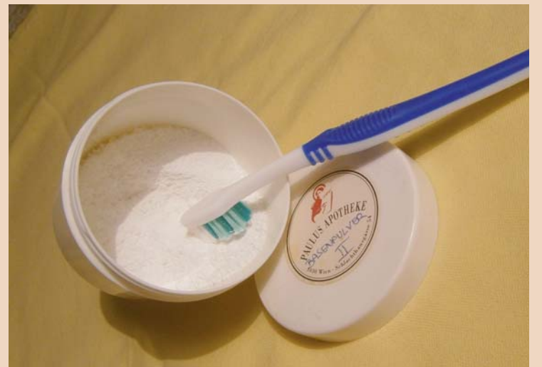
Putzen mit Soda.