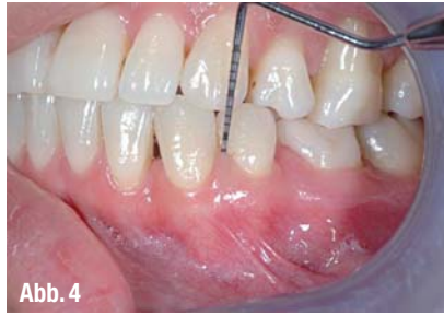
▲ Abb. 3: Cupral®-Applikation, Wiederholung nach einem Tag (© Dr. Steffen Biebl aus Würzburg). ▲ Abb. 4: Situation nach drei Wochen, fast vollständige Ausheilung. Die Gingiva zeigt eine physiologische Färbung und die Sondierungstiefe ist im Vergleich zur Ausgangssituation bereits deutlich reduziert (© Dr. Steffen Biebl aus Würzburg).

Das Präparat wirkt darüber hinaus gegenüber nichtinfiziertem Material gewebeschonend – die Ursache hierfür liegt in der Bildung einer Calciumcarbonat-Membran, die beim Kontakt zum durchbluteten Gewebe entsteht und die