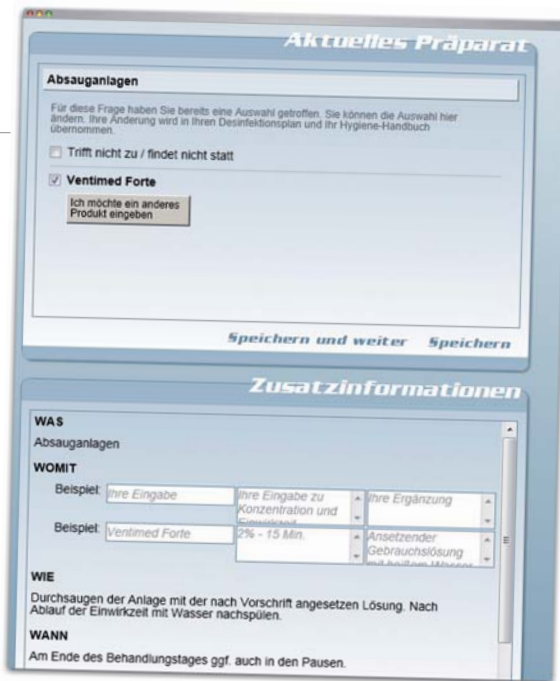
Abb. 3: Sollten sich Produkte ändern, kann diese Änderung zur erneuten Freigabe eingereicht werden.

Hygienepartnerschaft mit dem Unternehmen eingehen. Diese beinhaltet zusätzlich folgende Leistungen: