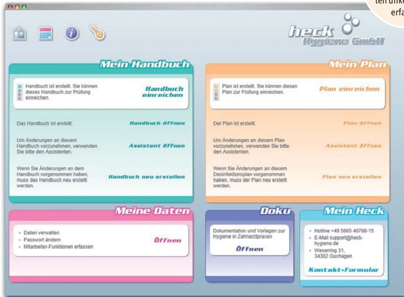
Abb. 1: Mit dem webbasierten Hygieneplan lassen sich Daten unkompliziert erfassen.

Im Praxisalltag spielt Hygiene eine wichtige Rolle. Damit das Personal und der Patient ausreichend geschützt sind und gleichzeitig noch genug Zeit für einen persönlichen Kontakt in der Praxis bleibt, ist ein vereinfachter Hygieneprozess unerlässlich. Ein webbasierter Hygieneplan hilft, gesetzliche Anforderungen in diesem Bereich schnell und unkompliziert zu erfüllen, auf hohem technischen Niveau.