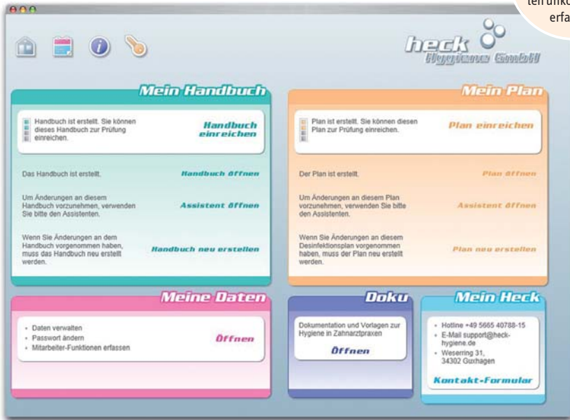
Abb. 1: Mit dem webbasierten Hygieneplan lassen sich Daten unkompliziert erfassen.

Im Praxisalltag spielt Hygiene eine wichtige Rolle. Damit das Personal und der Patient ausreichend geschützt sind und gleichzeitig noch genug Zeit für einen persönlichen Kontakt in der Praxis bleibt, ist ein vereinfachter Hygieneprozess unerlässlich. Ein webbasierter Hygieneplan hilft, gesetzliche Anforderungen in diesem Bereich schnell und unkompliziert zu erfüllen, auf hohem technischen Niveau.