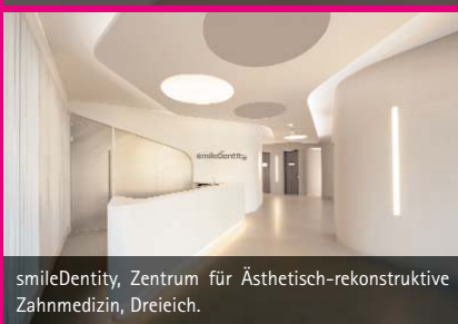
smileDentity, Zentrum für Ästhetisch-rekonstruktive Zahnmedizin, Dreieich.