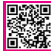
Bildergalerie Prämierte vom ZWP Designpreis 2013.

Dieser virtuelle Rundgang bietet per Mausclick die einzigartige Chance, Praxisräumlichkeiten, Praxisteam und Praxiskompetenzen informativ, kompakt und unterhaltsam zu präsentieren. So können sich die Nutzer bequem mithilfe des Grundrisses oder von Miniatur-Praxisbildern durch Empfang, Wartebereich oder Behandlungszimmer bewegen, als individuelles Rundum-Erlebnis aus jeder gewünschten Perspektive. Gleichzeitig lassen sich während der 360grad-Praxistour auch Informationen zu Praxisteam und -leistungen sowie Direktverlinkungen aufrufen. Nachhaltiger Mehrwert ist damit garantiert.