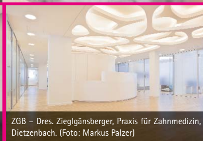
ZGB – Dres. Zieglgänsberger, Praxis für Zahnmedizin, Dietzenbach.