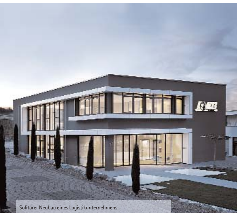
Solitärer Neubau eines Logistikunternehmens.

Der Grundstein für eine gelungene Positionierung und somit für den dauerhaften Erfolg eines Unternehmens wird durch ein präzises, klar differenzierbares Image gelegt. Im Vorfeld stehen detaillierte Analysen der eigenen Praxis und des Marktumfeldes. In intensiver Kooperation mit Gestaltern definieren Unternehmer die Kompetenzen, Stärken, Ziele, Visionen, Werte und Ideale ihres Betriebes. Sie machen den einzigartigen Charakter des Unternehmens aus und bietet die Möglichkeit, sich von vergleichbaren Wettbewerbern abzuheben. Durch die Kommunikation dieser Individualität nach außen weist man konkreten Zielgruppen den Weg in die passende Praxis.