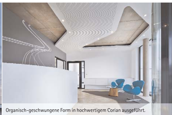
Organisch-geschwungene Form in hochwertigem Corian ausgeführt.