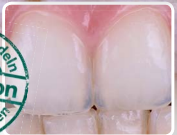
NACH der Behandlung mit Icon