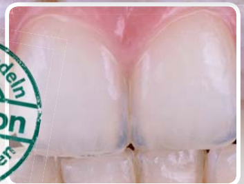
NACH der Behandlung mit Icon