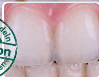
NACH der Behandlung mit Icon